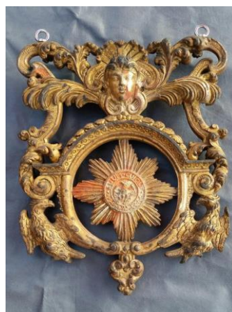
Fragment. Stiftung von Dirigent Christian Thielemann